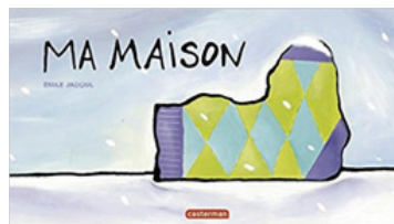
E. Jadoul Casterman

ZIGZAG 2018, à bientôt, après les vacances d'été!