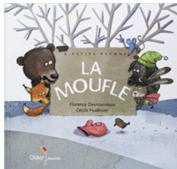
F. Desnouveaux C. Hudrisier Didier Jeunesse

Quelques versions du conte traditionnel russe LA MOUFLE ..... et une autre histoire qui lui ressemble